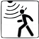
Sensor de movimiento